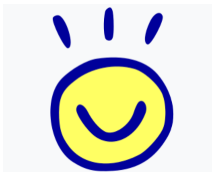
Logo de Toki Pona

Toki Pona staras kiel unika esperimento en la lingva mondo, kreita de la artisto kaj lingvisto Sonja E. Kisa komence de la 21-a jarcento. Simile al Esperanto, ĝi estas konstruita lingvo kun misio disrompi kulturajn limojn kaj krei konektojn en kompleksa mondo.