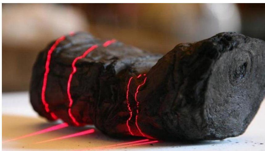
Unu de la Herculaneum-roluloj